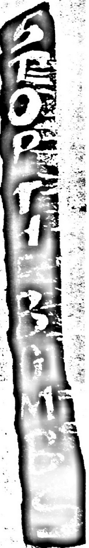
Un momento della manifestazione di domenica ad Aviano.